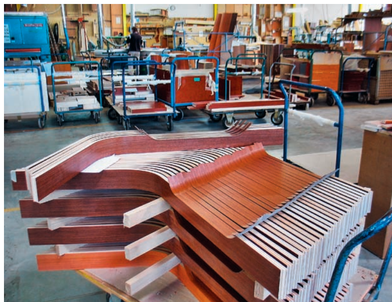
Typische Bauteile, wie sie mittels Fünfachs-CNC-Bearbeitung bei der Schüler Holztechnik GmbH im thüringischen Frankenheim produziert werden

Schüler Holztechnik GmbH setzt auf durchgängige CAD-CAM-Lösung