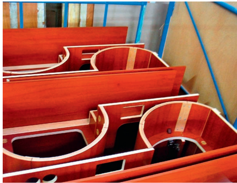
Alles andere als Kastenmöbel: Mit anspruchsvoller Technik und fachlichem Können sprengt Schüler immer wieder Grenzen

oberfläche Xilog Plus. Die grafische Oberfläche zeigt die in der Bearbeitung befindlichen Werkstücke, hier lassen sich Daten aktuell optimieren, hier erfolgt auch die Bearbeitungssimulation. Zwei Dreiachs-BAZ's hat Schüler im Einsatz, eine Auslegermaschine SCM Tech 99 und ein großes Portal-BAZ Typ Planet von Morbidelli. Letzteres ist mit zwei Werkstücktischen ausgerüstet und verfügt über eine Kantenanleimeinrichtung für gerundete Werkstücke.