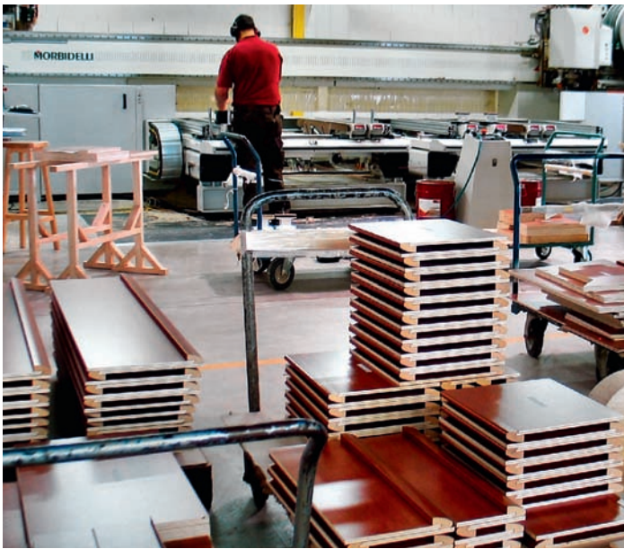
Eine von insgesamt drei CNC-Bearbeitungszentren: Großes Portal-Bearbeitungszentrum (Typ Planet) von Morbidelli