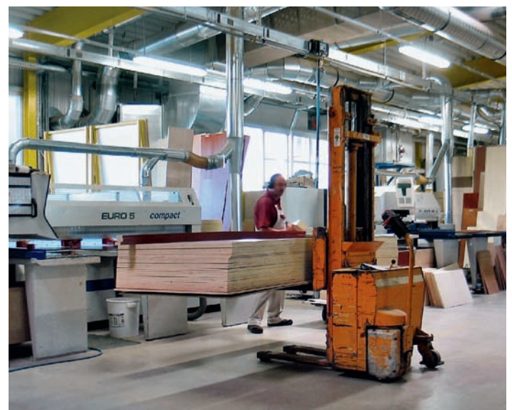
Zwei Plattenaufteilanlagen sorgen beim Caravan-Spezialisten für den erforderlichen Materialnachschub