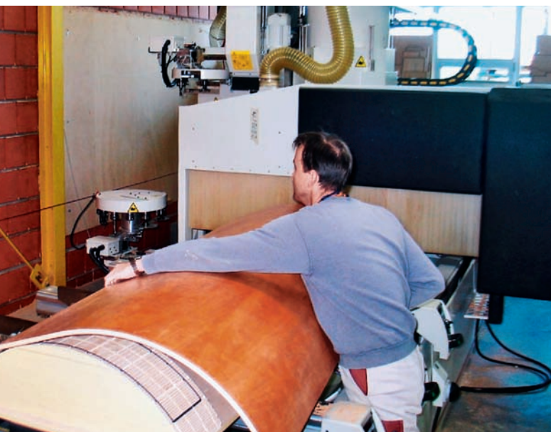
Die Vakuumform wurde mit der Funktion „Negativform“ in TopSolid'Wood konstruiert und auf diesem Fünfachs-BAZ von Morbidelli gefertigt