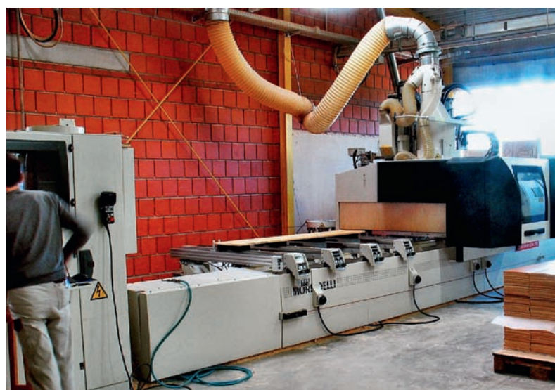
... um dann sicher „real“ bearbeitet zu werden. Auf dieser Maschine werden insbesondere die zahlreichen gerundeten Bauteile produziert