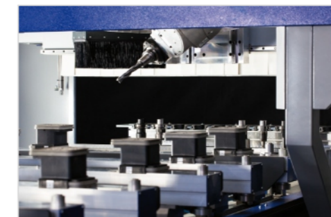
Kardanischer Kopf mit Originalwinkelberechnung aus TopSolid'Wood