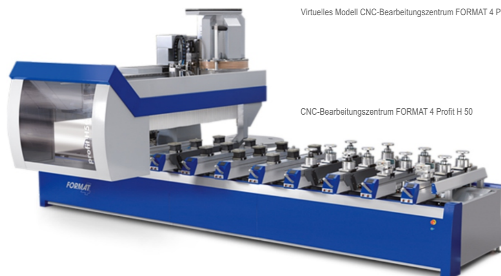
CNC-Bearbeitungszentrum FORMAT 4 Profit H 50