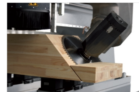
Ø 350mm Sägeblatt